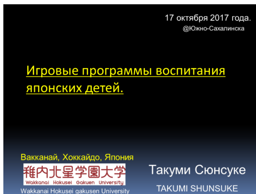
写真2 学術シンポジウムにおける筆者の発表スライドの表紙