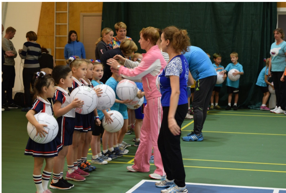
写真5 セレモニー前の整列指導をしている教師の様子