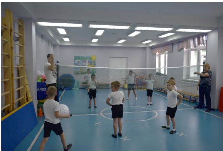
写真12 コルサコフの幼稚園におけるミニバレー（床に「×印」が見えている）