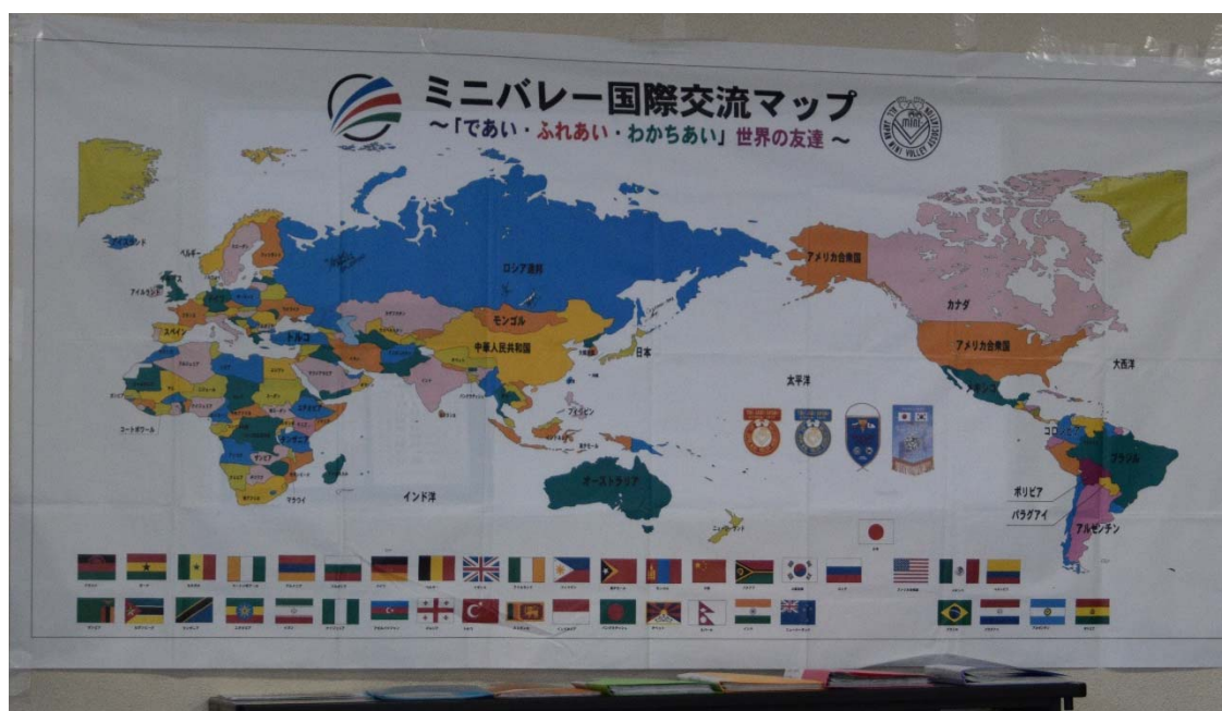
写真1: ミニバレー国際交流マップ (ミニバレージャパンカップ2018 in 札幌において撮影)

さらに、ロシアにおける特徴的なことは、幼児や障がい者へのミニバレーの普及である。2012年から2017年の5年間にわたり『友情のボールプロジェクト』が展開された。2017年にはパシュコフ教授により、その成果発表会が企画された。さらに2018年には、パシュコフ教授によって教科指導書本である「Физическая культура. Мини волейбол」(筆者による英訳: physical culture Mini-Volleyball)が執筆され、その学術成果がまとめられた。