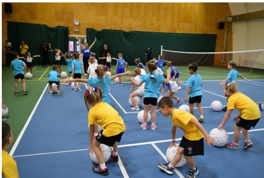
写真7 大会前にミニバレー体操をする幼児たち