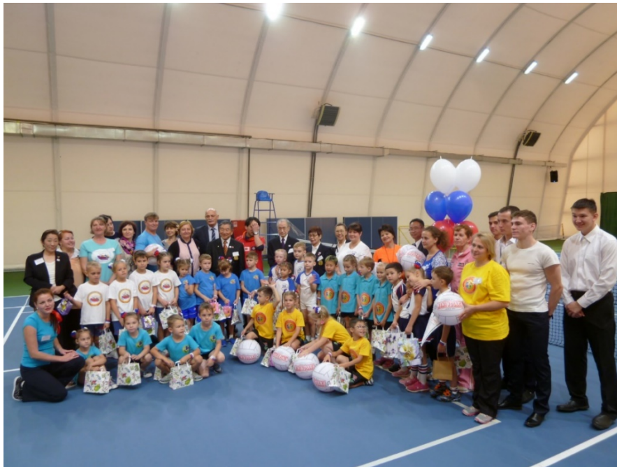
写真10 大会関係者による記念撮影