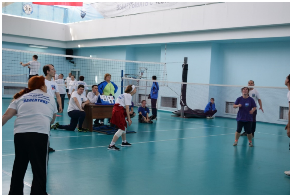
写真15 ミニバレー大会の様子(白いTシャツチームの左胸には車いすをデザインしたチームマーク、紫色の女性はろうあ者)