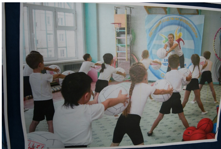
写真8 幼稚園でのミニバレー体操の様子（大会会場にあった写真より）