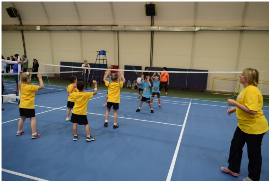
写真6 幼児のミニバレーの大会の様子と厳しく指導する教師

②の「ミニバレー体操」は、我が国には無いものであった。ボールエクササイズをミニバレー風にアレンジしたものであった。ミニバレーのボールを一人ひとつ持ち、音楽に合わせて簡単なストレッチを行うのであるが、先生の見本を見ながら幼児は笑顔で取り組んでいた（写真7, 8）。