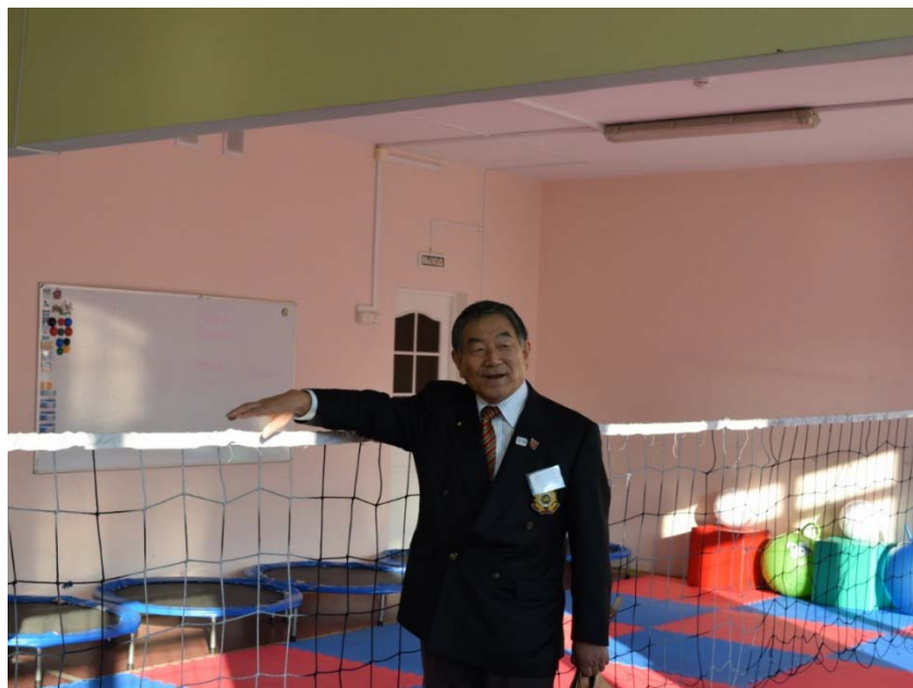
写真11 ユジノサハリンスクの幼稚園における運動環境（天井の梁が見えている）

稚園では、床にテープで「×」の目印をつけ、幼児にポジションを教えている様子であった。筆者も彼らとプレーしたが、すぐに天井に当たってしまい、大人ではラリーを続けることが困難であった(写真12, 13)。