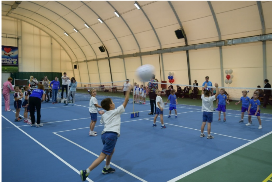
写真9 ミニバレーの大会の様子 男児による力強いサーブ